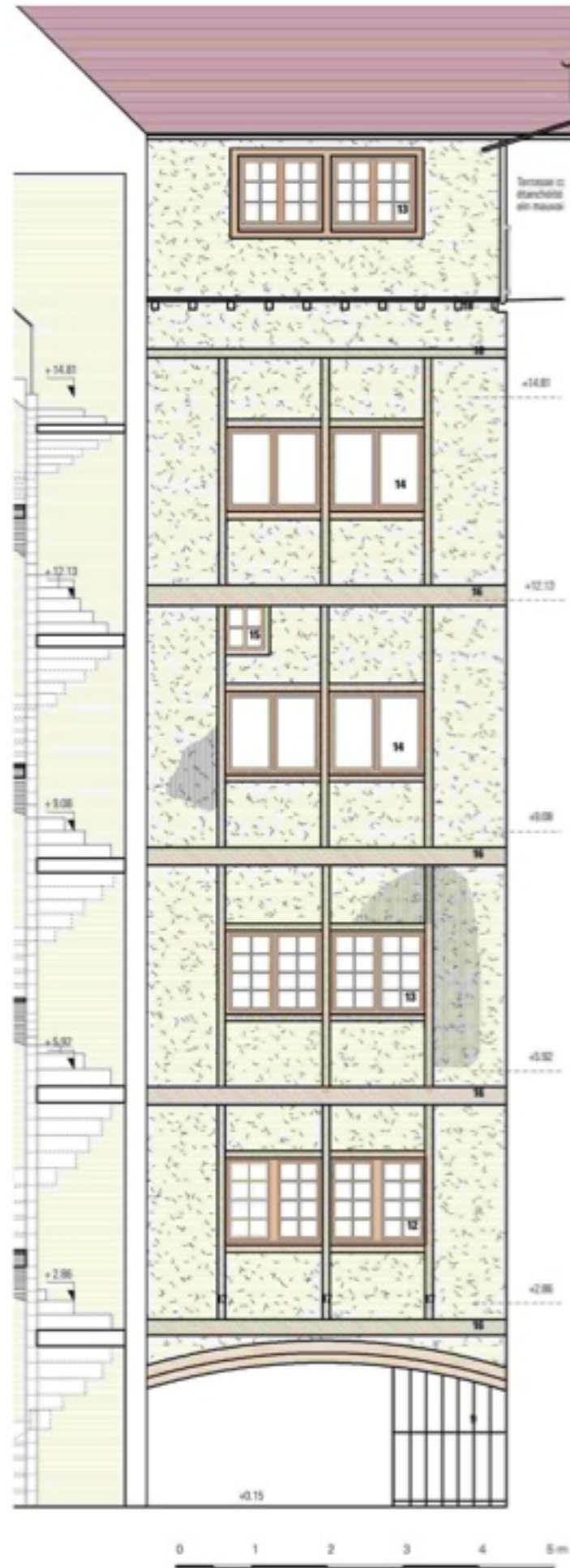
Façade sur Coursive État Existant