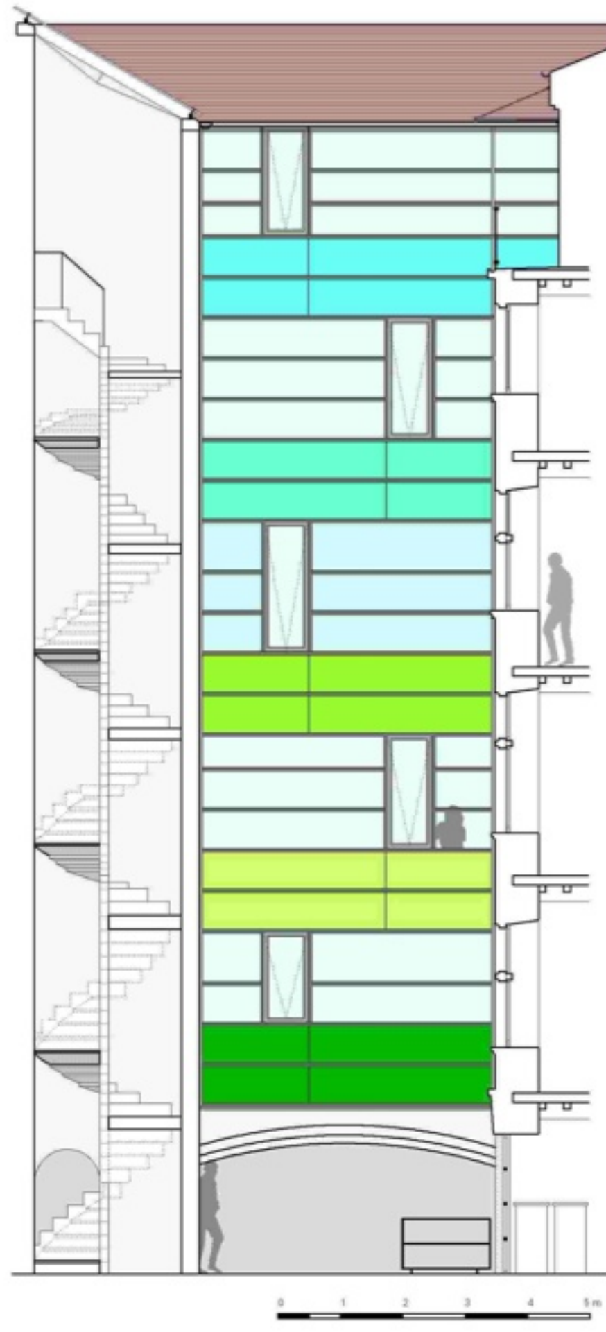
Façade sur Coursive État projeté

Restructuration et remise aux normes de tous les équipements techniques du bâtiment, isolation intérieure des murs par 20 cm de ouate de cellulose, traitement des façades par nouvel enduit, remplacement des menuiseries extérieures par double fenêtres (bruit et thermique).