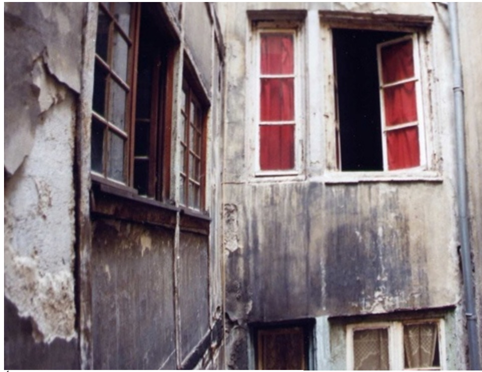
État de la Façade avant Travaux