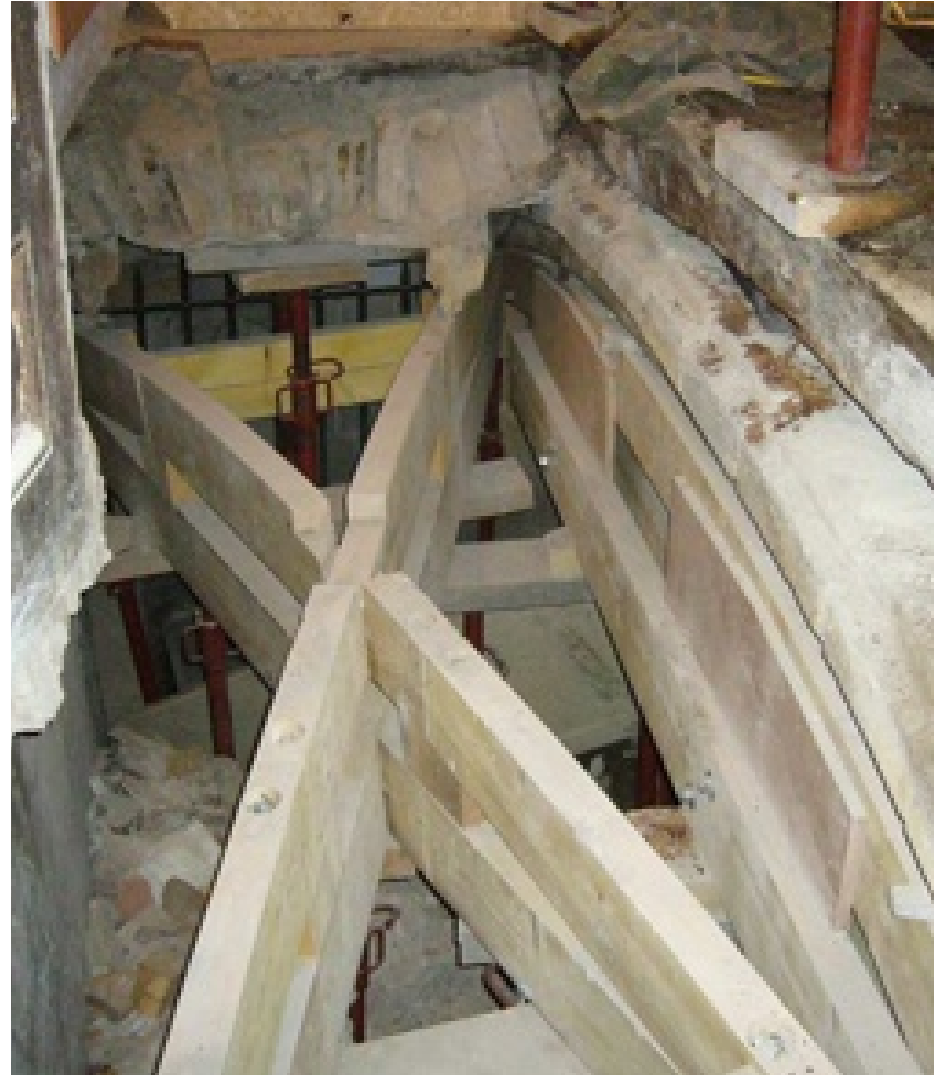
Restauration de la Voûte