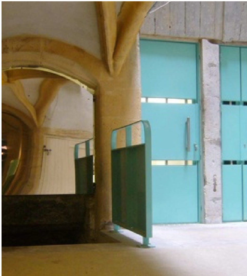
Nouvelle Porte dans la Cour