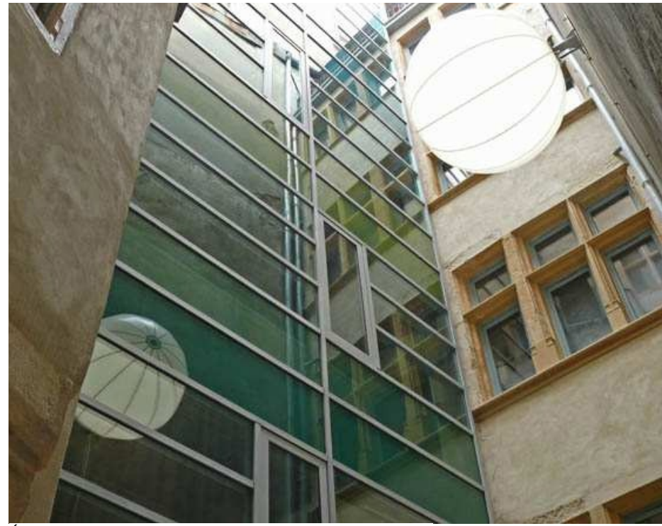
État de la Façade après Travaux