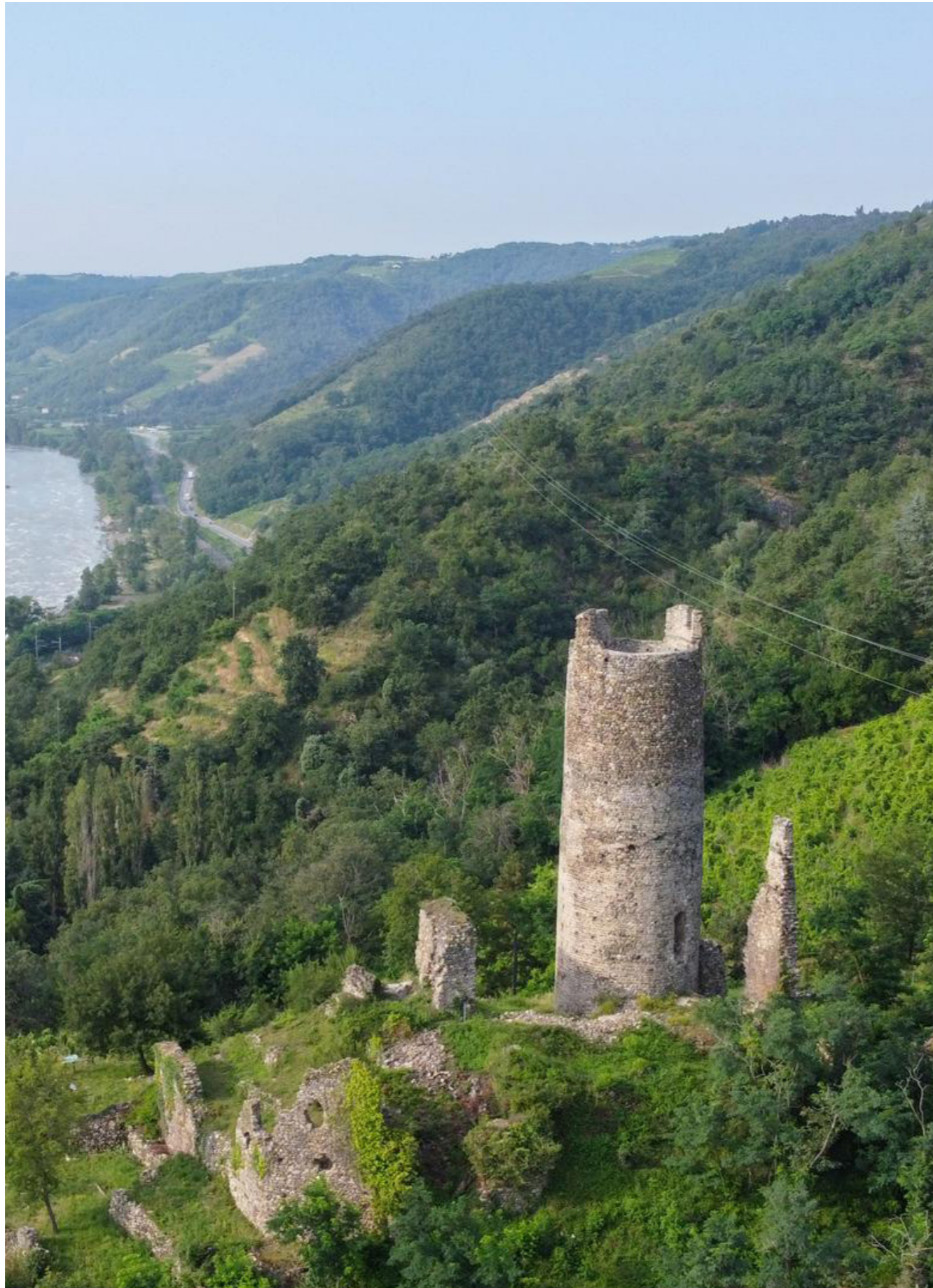
Vue actuelle sur la tour

Équipe de maîtrise d'œuvre : DLAA.Archi (Architecte du patrimoine), CETEAM (Ingénierie structure)