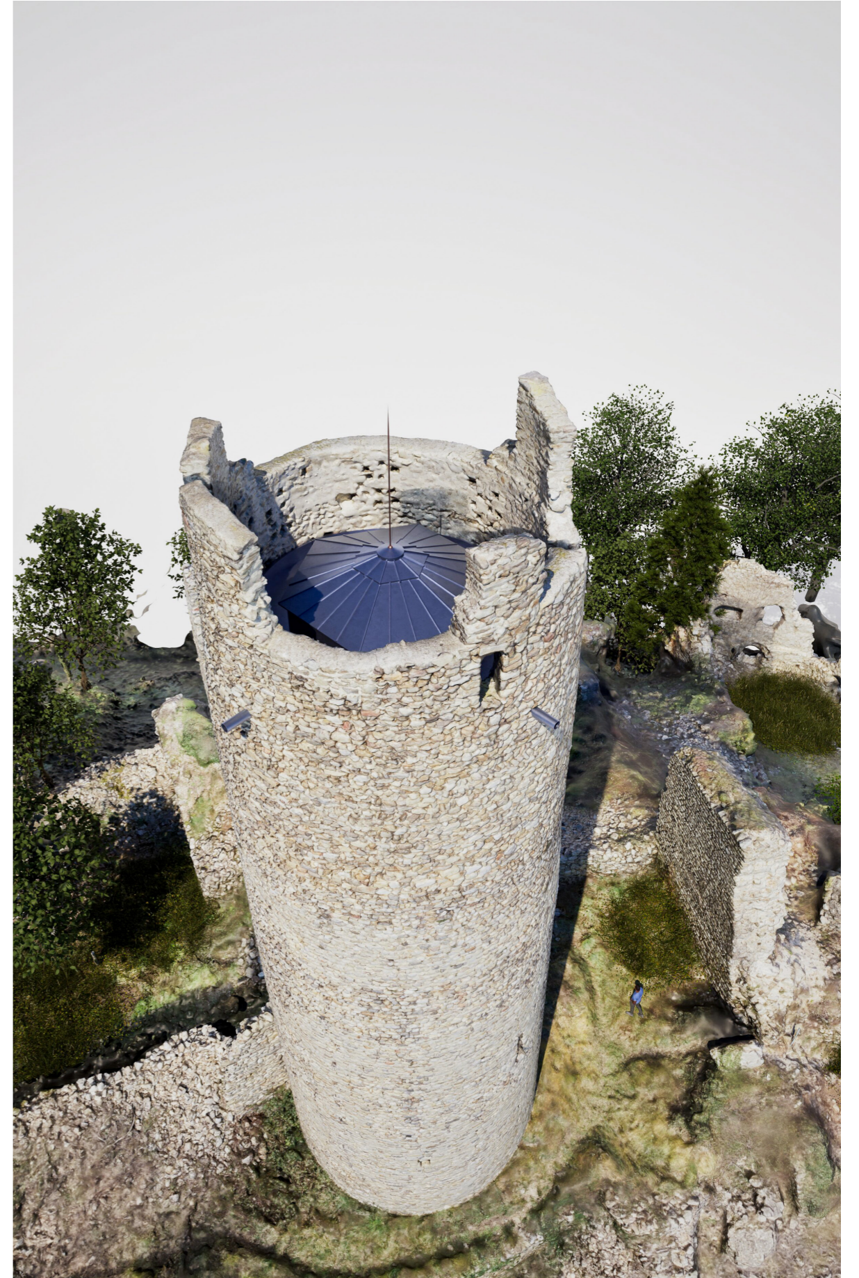
Perspective aérienne du projet